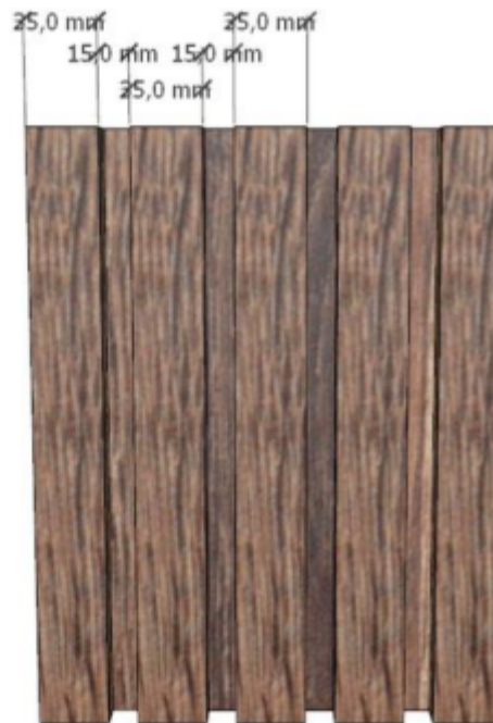
Listones de 35mm y separación entre listones de 15mm